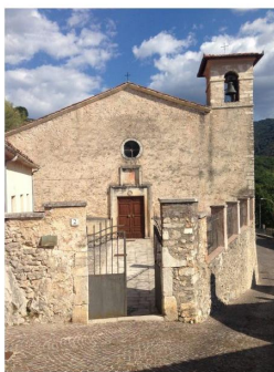
Chiesa di San Giovanni Battista

Nel 1974, alcune scene del film « Milarepa » (ambientato in Tibet e girato in Abruzzo ) della regista Liliana Cavani furono girate sulle montagne a ridosso del paese , mentre alcune panoramiche del centro storico apparvero nel celebre film di avventura « Ladyhawke » (1985), diretto da Richard Donner , con protagonista Michelle Pfeiffer . Nel 1988 e nel 2008 il castello di Pereto fu una delle location del film horror « Delirio di sangue »