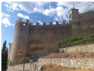
Il castello di Pereto

Il borgo, che conta poco più di 600 abitanti , è dominato da un maestoso castello normanno realizzato nel XIII secolo , che si trova alle pendici del Monte Forcellese . Simbolo del paese, venne edificato nella sua forma attuale da Federico II di Svevia , mentre il centro storico, molto caratteristico, conserva la sua struttura medievale e l'originale cinta muraria.