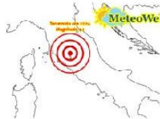
Terremoto 4.1 al Centro Italia, la protezione civile della...