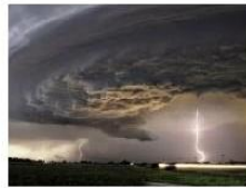
Allerta Meteo per il Ponte del 2 Giugno: ecco...