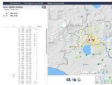
Terremoto 4.1 al Centro Italia, l'esperto: "sismicità tardo-vulcanica tipica..."