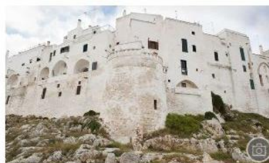
10 bellissime città bianche da vedere in Italia