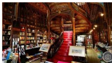
Librerie magiche tra cinema e realtà