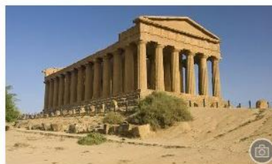
I paesi al mondo con più siti Unesco (Italia al top)