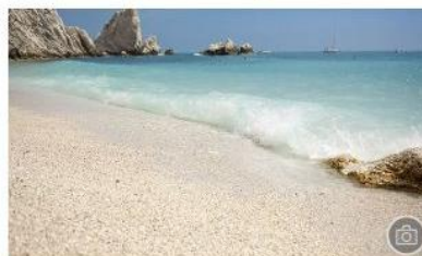
Le 5 spiagge italiane migliori per fare surf