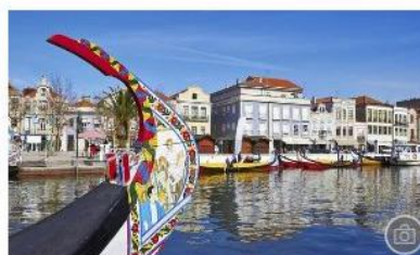
I 20 luoghi più nascosti in Europa