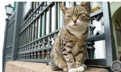
16 mete turistiche per gattofilo impenitenti