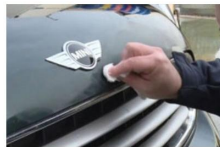
Come togliere i piccoli graffi