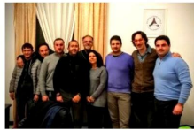
Protezione Civile, nasce coordinamento Val Vibrata con 5 associazioni