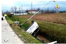
Lunedì i funerali dell'assicuratore teramano