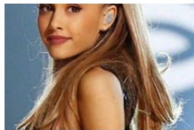
Ariana Grande: incidente live con la giacca durante un'esibizione