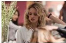
Bollente nel letto: Justin Mattered tutta nuda