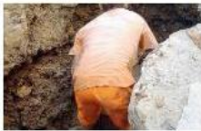
Acqua e fogna, Aqp investirà 167 milioni A€ nel Foggiano - home - La Gazzetta de...