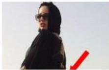
Foto imbarazzanti rubate dalla rete