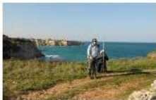
Carovana di «camminanti» alla scoperta del Salento - home - La Gazzetta del Mezz...