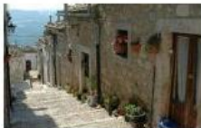
In 4 paesi dauni il Festival dei borghi più belli - home - La Gazzetta del Mezzo...