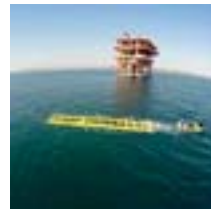
Protesta in mare