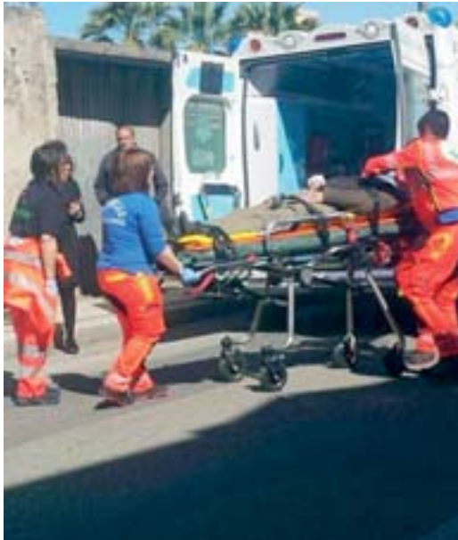
L'intervento dell'ambulanza in via Porcella