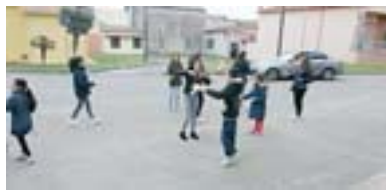
Giochi in piazza

► Giorni di grande impegno per il centro di educazione ambientale di Masullas. Tanti i laboratori organizzati per la Pasqua: su nenniri, semi di grano germogliati al buio, come segno di prosperità. L'intreccio delle palme con la confraternita e i suoni delle tradizioni sarde per il Venerdì Santo. (an. pin.)