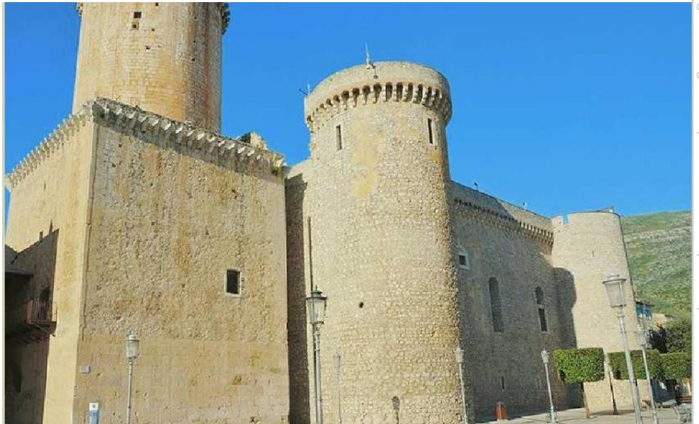
Nella foto il Palazzo e Castello Baronale di Fondi che stasera ospiterà la manifestazione