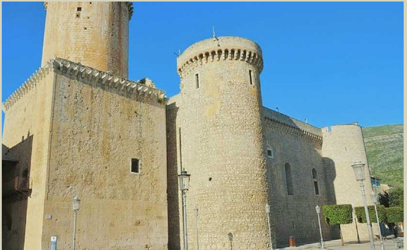
Nella foto il Palazzo e Castello Baronale di Fondi che stasera ospiterà la manifestazione