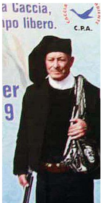
Il manifesto della fiera (Moscatelli)

Il momento di maggior richiamo è però la preparazione della "cordula" più lunga di tutti i tempi, alla quale seguirà il Primo concorso gastronomico a premi con ricette a base di "cordula". (t.g.t.)