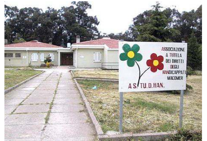
La sede dell'Astudhan di Macomer

vita dignitosa e il più possibile autonoma. Prevede la realizzazione di piccole strutture residenziali per accogliere un numero ristretto di disabili, da cinque a non più di otto, che a causa di accadimenti negativi (decesso, malattia, ricovero dei familiari) non possono avere