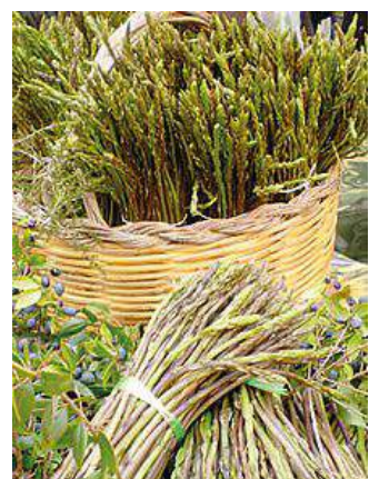
Mazzi di asparagi

to numero di richieste di occupazione del suolo comunale pervenute quest'anno da parte degli espositori che animeranno la fiera del gusto abbinata alla sagra degli asparagi e dei finocchietti, è atteso un buon afflusso di visitatori. L'intera giornata sarà scandita dalle visite negli stand dei prodotti agroalimentari sistemati nelle vie del centro, dal pranzo preparato dai volontari dell'associazione turistica, dagli intrattenimenti musicali e dalla degustazione dei prodotti tipici locali. (mac)