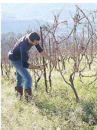
Potatura delle viti

Anche per il prossimo autunno sono in programma altri momenti formativi: la pubblicazione e presentazione degli atti del convegno di Viticoltura che si è tenuto a Modolo e la realizzazione di nuovi laboratori di viticoltura e potatura della vite e di corsi di formazione nel campo dell'enologia.