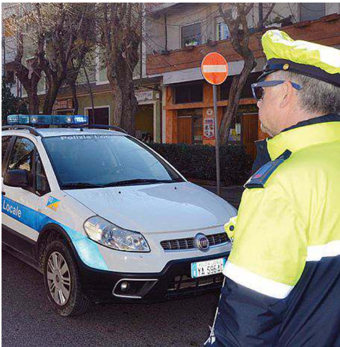
Vigili urbani a Bosa