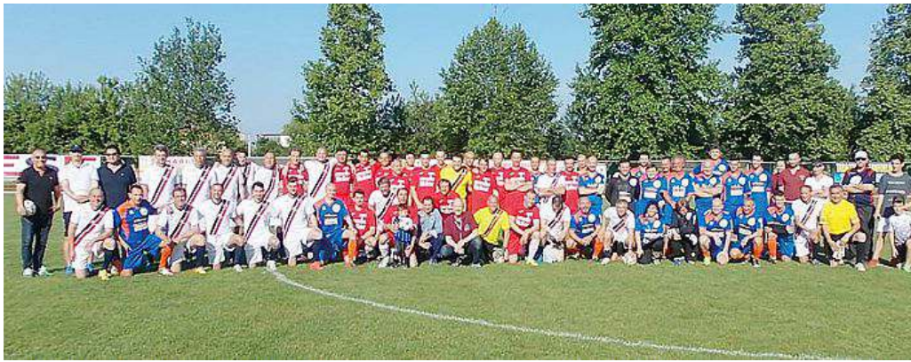
I protagonisti del torneo benefico schierati in campo a Copparo prima del via alle partite