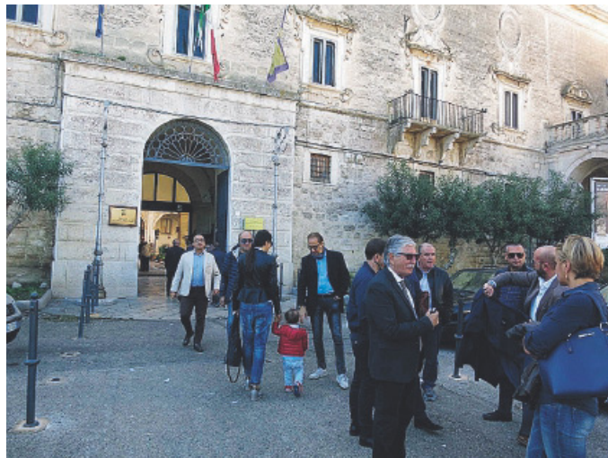
AL VOTO Le elezioni di domenica scorsa alla provincia