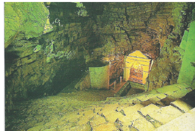
GROTTA La grotta di san Michele Arcangelo