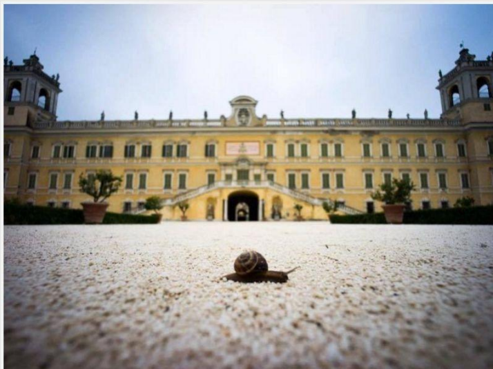
La seconda edizione del Festival della Lentezza si terrà dal 17 al 19 giugno nella splendida cornice della Reggia Ducale di Colorno

Quest'anno, questa seconda edizione, appoggiamo lo sguardo a questa fetta di mondo. Perché alle donne è chiesto uno sforzo doppio, rispetto al già complesso rapporto con il nostro tempo. Costrette a rincorrerlo continuamente, pur essendo di animo lento, istintivamente. Nella cura materna. Nel sentire. Nello stare nello spazio in cui si muovono, ogni giorno".