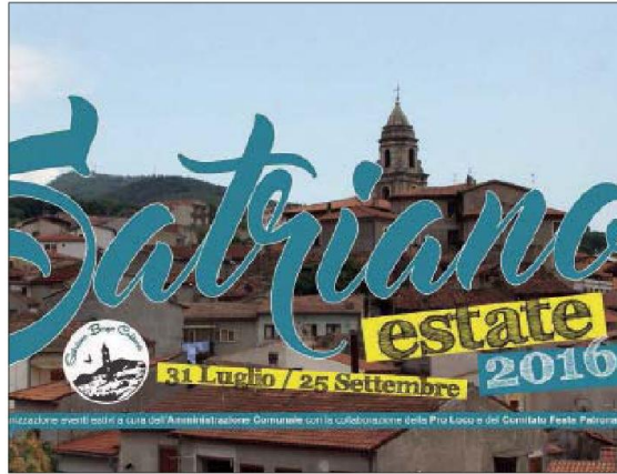
Il logo scelto per il calendario degli appuntamenti estivi

Il calendario degli eventi è organizzato dall'amministrazione comunale, grazie anche alla preziosa collaborazione della Pro loco e del comitato feste patronali San Rocco.