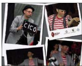
Cico nelle sue vesti di mimo e di clown

“E...STATE a Filiano”. Già dal nome si capisce che il programma degli eventi estivi 2016 della Pro Loco di Filiano e di varie associazioni filianesi si pone come obiettivo primario: far rimanere i cittadini e attirare sempre più turisti all'interno del territorio filianese.