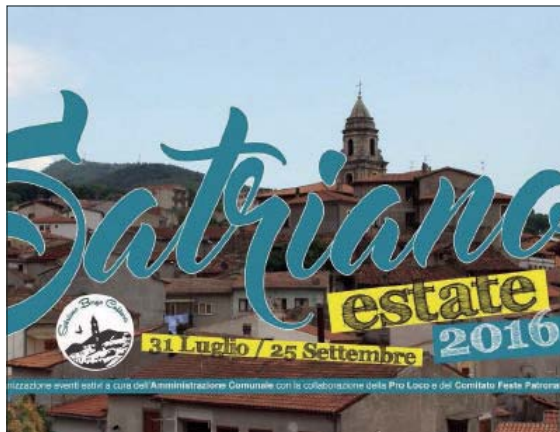
Il logo scelto per il calendario degli appuntamenti estivi

Il calendario degli eventi è organizzato dall'amministrazione comunale, grazie anche alla preziosa collaborazione della Pro loco e del comitato feste patronali San Rocco.