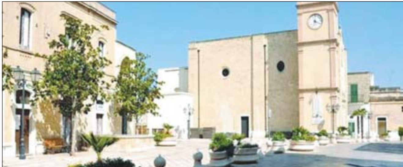
In alto la chiesa di Galatone, a sinistra una delle piazze di Patù e, in basso a sinistra, la chiesa di Morciano di Leuca

Eventi nei sei Comuni che rientrano nella lista tra arte, concerti, mostre e degustazioni