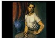
ACHILLE VIRGILIO SOCRATE FUNI (ACHILLE FUNI)