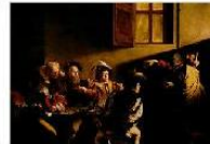
VOCAZIONE DI SAN MATTEO MICHELANGELO MERISI (CARAVAGGIO) CHIESA DI SAN LUIGI DEI FRANCESI