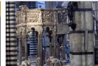
PULPITO DEL BATTISTERO DI PISA PISA