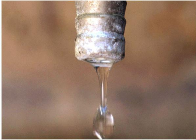
Acqua: al via campagna social #salvalagoccia

Redazione ANSA 21 marzo 2016 18:25 Scrivi alla redazione Stampa