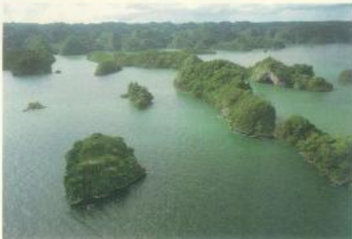
La Isla de los Pajaros, posta nell'estremo nordovest, è una delle mete meno note che la Repubblica Dominicana si sta impegnando a far conoscere all'industria del travel

In Repubblica Dominicana infine non manca nemmeno la valorizzazione di mete poco note sul mercato internazionale. Come Montecristi, nell'estremo nordovest del Paese dove, oltre alla barriera corallina, si trovano il bellissimo parco nazionale di El Morro, tra mangrovie, pellicani e distese di gigari, e le Cayos Los Siete Hermanos, isolette vergini che delimitano un'area corallina di 30 km con un'incautevole fauna marina. E ancora negli ultimi anni l'offerta turistica di Puerto Plata si è ampliata con una vasta gamma di strutture alberghiere di grande pregio, quali Casa Colonial, Blu Jack Tar, Grand Paradise e Gran Ventana. Costanza infine è la più bella valle del Caraibi, con temperature fresche, una forte cultura e luoghi di una bellezza mozzafiato, come l'ecolodge Villa Pajón, nel Parco Nazionale Valle Nuevo, che ha bei sentieri che attraversano foreste di pini e torrenti d'acqua o la Riserva Scientifica Ebano Verde che offre passeggiate nella foresta. La zona presenta una varietà di ranchos immersi nella natura che organizzano anche numerose escursioni legate all'avventura e all'ecoturismo, tra le quali rafting, zip line, passeggiate a cavallo. È una destinazione must per chi ama stare all'aria aperta.