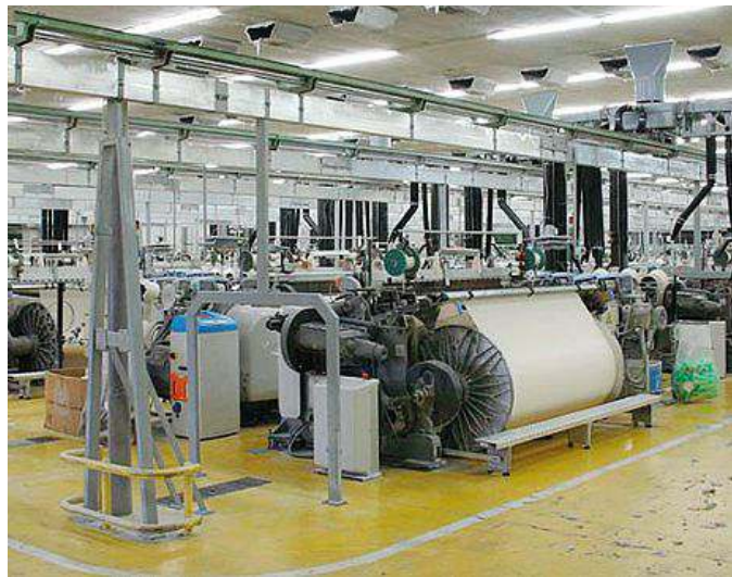
Lo stabilimento della Legler di Macomer

L'accordo per i tessili della provincia di Nuoro inizia lentamente a muoversi e a produrre i primi risultati. Si tratta di poca cosa rispetto alle effettive necessità di una categoria che la crisi ha lasciato senza lavoro, ma potrebbe essere l'inizio di una nuova stagione. Il 10 marzo sarà pubblicato il bando per il microcredito e l'autoimpiego che ha in dote un milione di euro, mentre il 21 marzo chiuderà la misura «Flexicurity» per la quale bisognerà poi vedere quanti lavoratori tessili sono riusciti a inserirsi in un tirocinio. La misura «Welfare to work» è stata attuata con un bando riservato ai tessili e i termini per presentare domanda sono scaduti il 31 dicembre. Poi c'è la partita dei «Cantieri verdi» proposti dalla Regione come soluzione tampone in attesa della soluzione che le politiche attive del lavoro avrebbero dovuto garantire con le altre misure. In termini di ri-