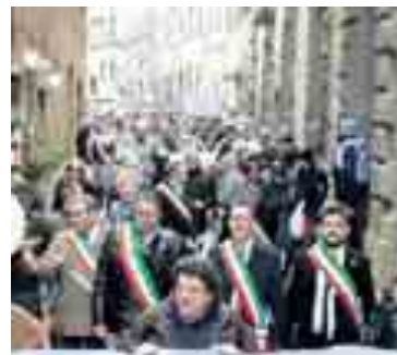
La protesta dei sindaci a Volterra

grido dei sindaci dei piccoli Comuni del Belpaese, che si sono autoconvocati, ieri, per sostenere le loro proposte all'insegna dell'"Orgoglio Comune". Un documento, frutto dell'assemblea riunita dopo il corteo sfilato per le vie della città, mette nero su bianco i capisaldi. Dalle Marche, oltre al sindaco di Sirolo, ma non solo, anche una delegazione di Belvedere Ostrense e di Montecopio. Misiti rilancia: "Siamo oltre cento e andiamo avanti: Non ci fermeremo. Siamo pronti a forme di disobbedienza civile come le dimissioni dal ruolo di ufficiale del Governo".