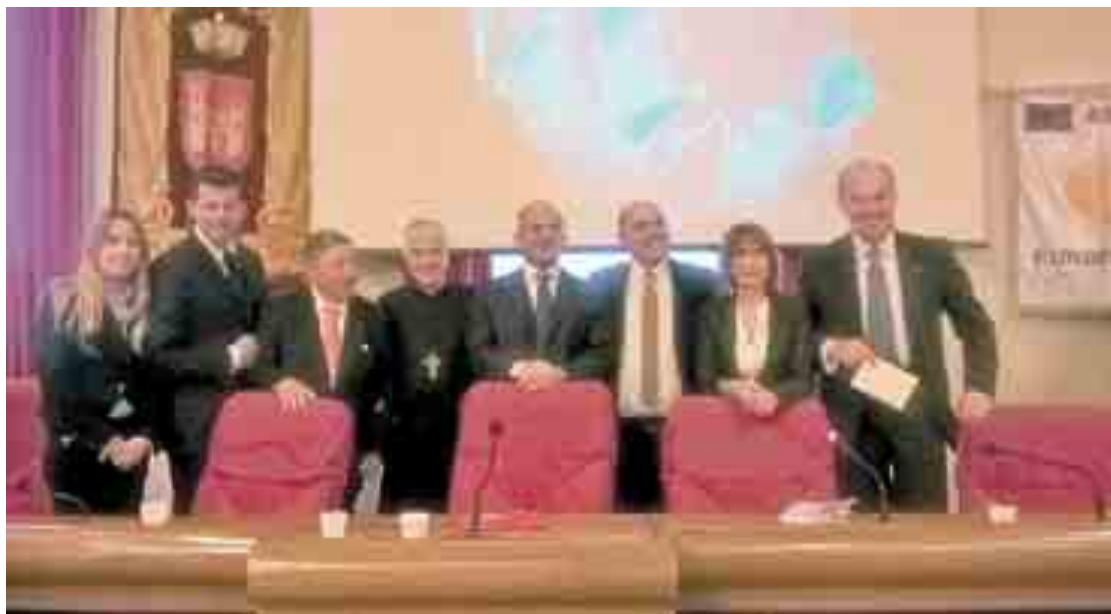
I protagonisti dell'inaugurazione della mostra ieri ad Ascoli