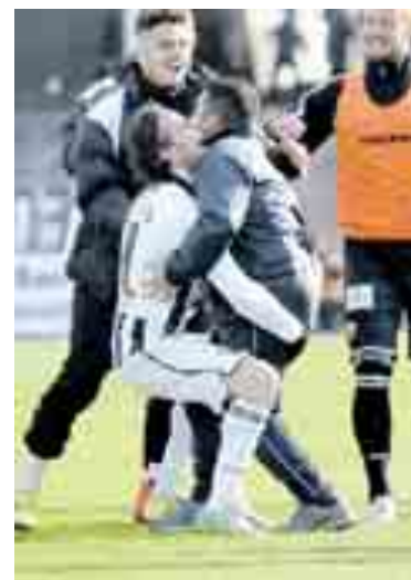
Non è bastata la doppietta di Cacia