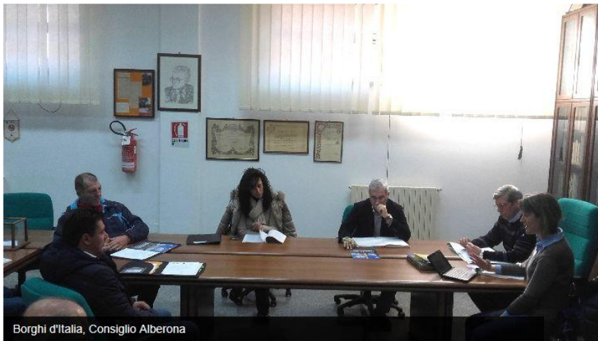
Borghi d'Italia, Consiglio Alberona

Il piccolo borgo dei Monti Dauni nella rete nazionale dei Comuni impegnati nella costruzione di un nuovo modello di sviluppo incentrato sulla green economy, in cui protagonisti sono gli abitanti dei piccoli comuni