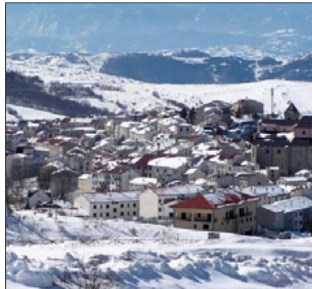
Una veduta panoramica del centro abitato di Capracotta

dello Stato, l'Associazione Forestali di Capracotta e diversi volontari, che ha consentito la mappatura con GPS della rete sentieristica del territorio di Capracotta con la realizzazione di un nuovo sito internet e l'acquisizione della cartellonistica da posizionare lungo i sentieri che saranno inclusi nel catasto nazionale di quelli del CAI. La stagione invernale quest'anno è partita senza problemi. Prato Gentile, con la sua nuova veste, ha le piste perfettamente innevate da oltre un mese. Come pure sono innevate le piste di Monte Capraro, dove finalmente dopo anni di difficoltà, si scia con regolarità grazie all'impegno di Funivie Molise Spa. Il ripristino del finanziamento regionale di 600mila euro