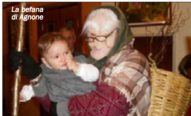
La befana di Agnone