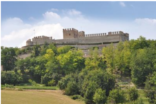
Montesegale (Pavia), uno dei 48 Comuni che aderisce alla Giornata dei Borghi Autentici