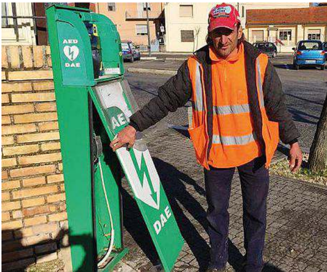
Il defibrillatore danneggiato da un immigrato ubriaco

con precedenti penali per furti, spaccio, attività illecite o pericolose, causa di disagi per la nostra comunità e ritenuti socialmente pericolosi», sottolinea Quaglieri nel documento, «sono costretto a richiedere l'allontanamento ed eventuale rimpatrio degli stessi. Pertanto chiedo alle autorità com-