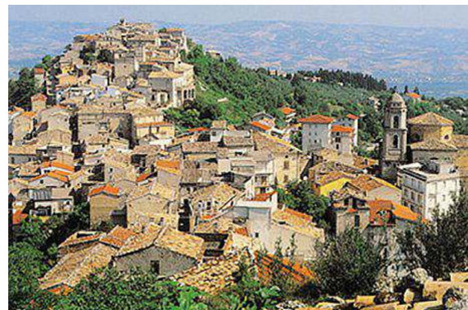
Una veduta del centro storico di Archi

Borghi autentici d'Italia è un'associazione che riunisce piccoli e medi comuni, enti ter-